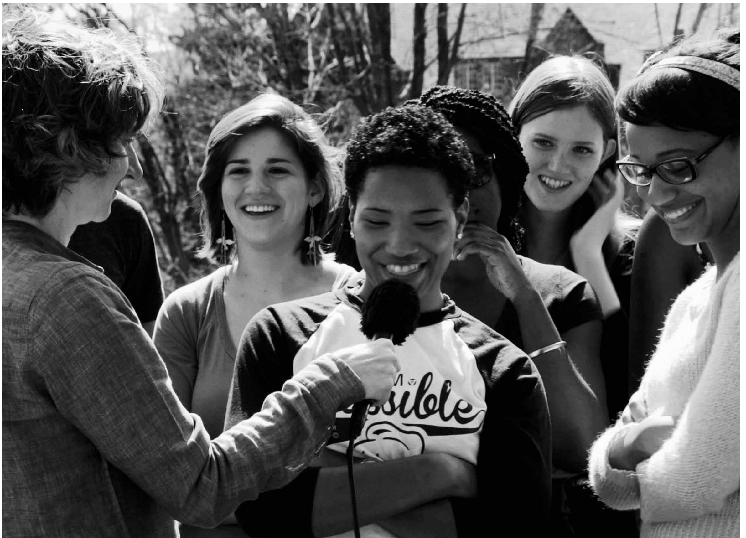
Sharon Hayes, Ricerche: three, 2013, single channel HD video, 38 min.